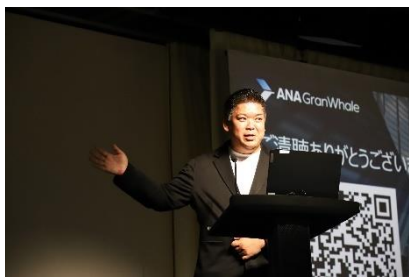
プロダクト紹介 「ANA GranWhale」 ANA NEO