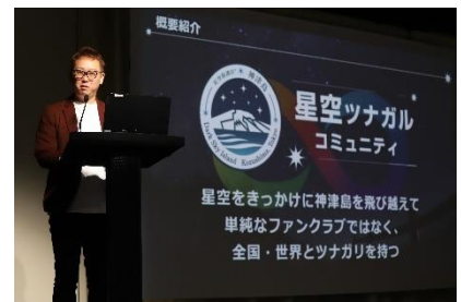
プロダクト紹介 「星空ツナガルコミュニティ」 テレビ朝日