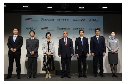
フォトセッション