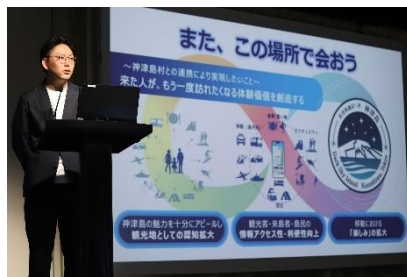
プロダクト紹介 「ANA Pocket」 ANA X