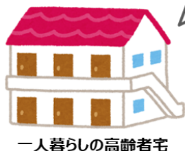
一人暮らしの高齢者宅

各ご家庭にIoT 見守りセンサー「LASHIC(ラシク)」を設置し、室内の温度・湿度・照度・運動量を確認