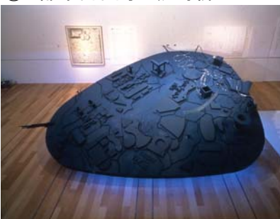
「海市—もうひとつのユートピア」展 1997年