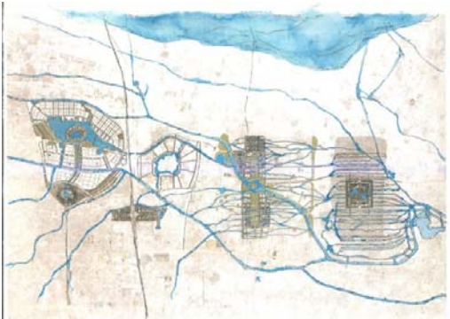
磯崎新《ギャラクシー(スケッチ)》

中国・鄭州市と開封市の間に広がる「鄭東新区」を舞台に、磯崎新およびゲストとのディスカッションなどを受け、状況や情報をもとに都市のモデルを考えるワークショップを行ないます。建築家やアーティストがプランを出しあい、それらのアイデアから、会期中さまざまにその様相を変えていきます。トーク・イベント、パフォーマンスなども行なわれる予定です。