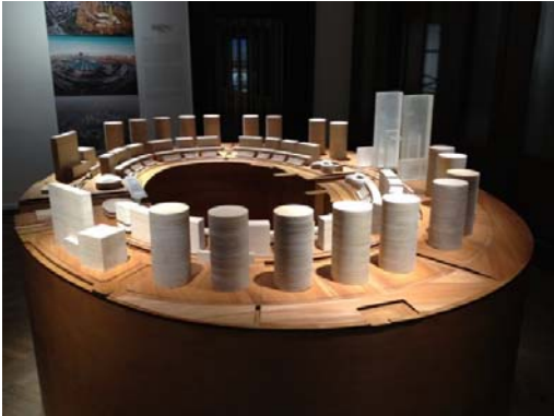
「鄭東新区龍湖地区副 CBD 都市計画」 1/500 模型 ヴェネツィア建築ビエンナーレ(2012)での展示風景