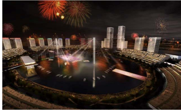
「鄭東新区龍湖地区副 CBD 都市計画」水上慶典広場(CG)