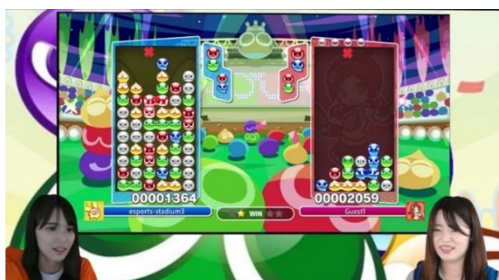
<表情・対戦画面等のリアルタイム合成イメージ>