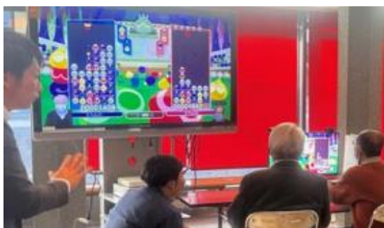
<「ぶよぶよ e スポーツ」の体験イメージ>

【「e スポーツ体験」コーナーのイメージ】 ※イメージであり、イベント当日の環境と異なりますのでご了承ください