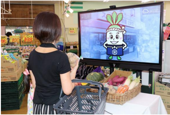
アバターによる接客販売