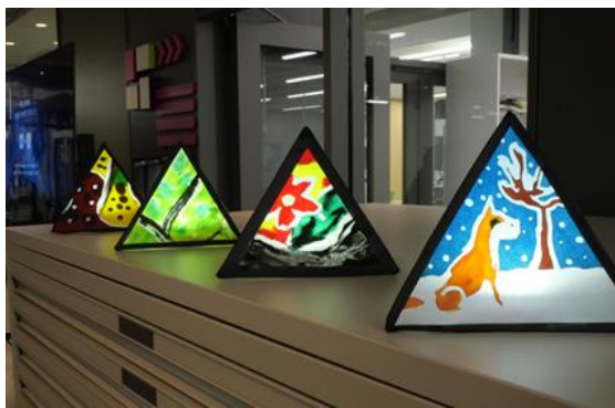
完成したねぶたをお披露目