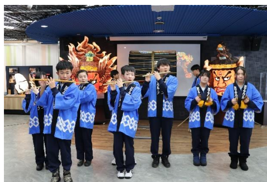
青森会場でのお囃子実演