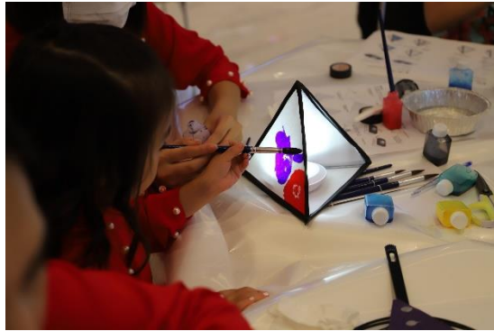
ベトナム会場でのねぶた制作の様子