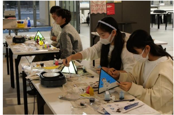
東京会場でのねぶた制作の様子