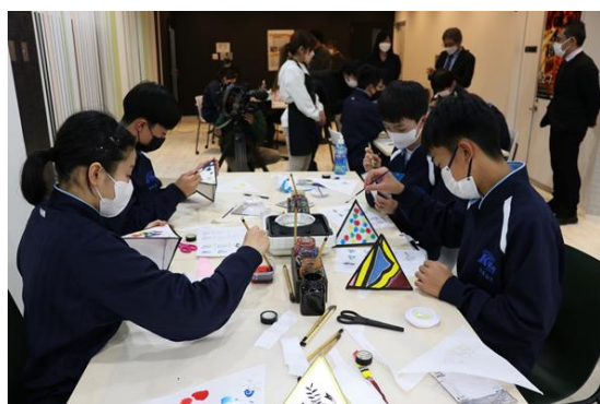
青森会場でのねぶた制作の様子