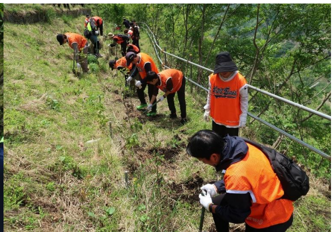
1 本 1 本丁寧に苗木を植えました