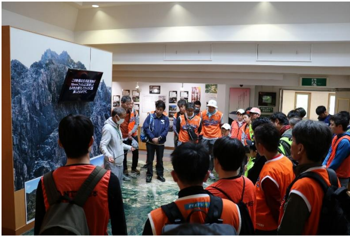
足尾の歴史についての講習