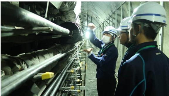
とう道見学の様子