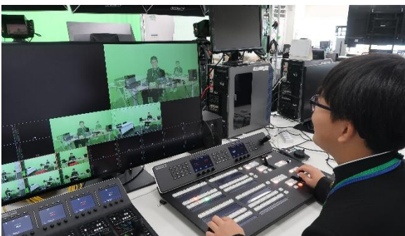
映像配信機器に触れる様子