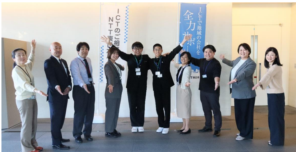
職場体験に参加した中学生と授業を担当したNTT東日本の社員・関係者

NTT東日本では、今後もICTを活用した探究型学習やキャリア教育の支援を通じて、地域社会と連携しながら次世代人材の育成に取り組んでまいります。