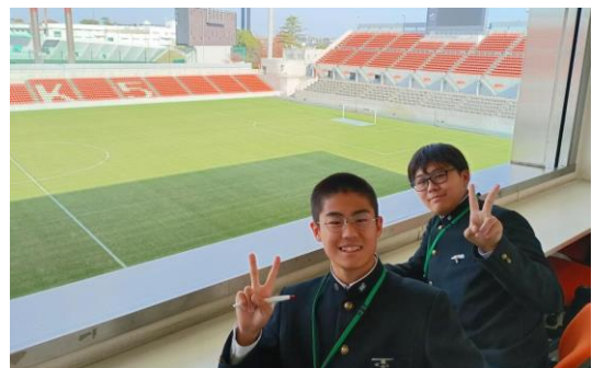
「NACK5 スタジアム大宮」見学の様子