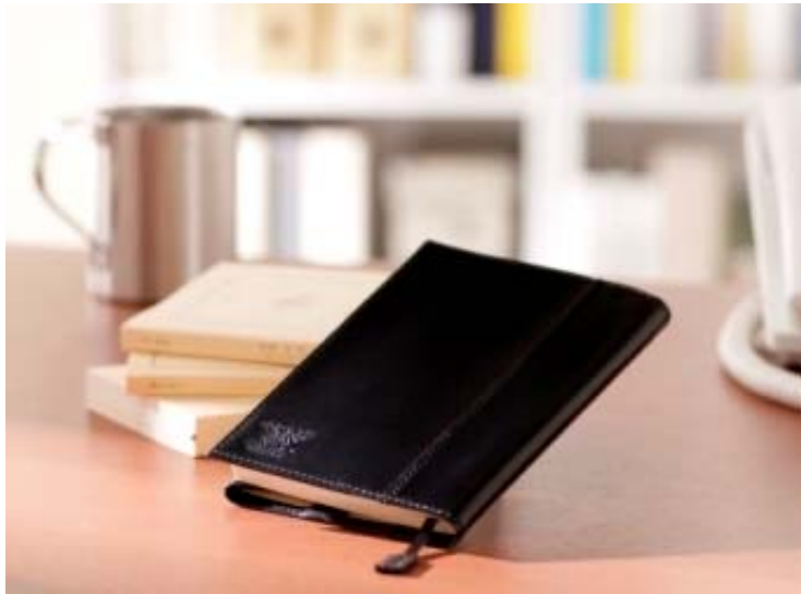
【素材】(表)牛床革、(裏)合成皮革 ※この製品は濱野皮革工芸のライセンスのもと、ベトナムで生産されたものです。 (文具類は本商品に含まれません)