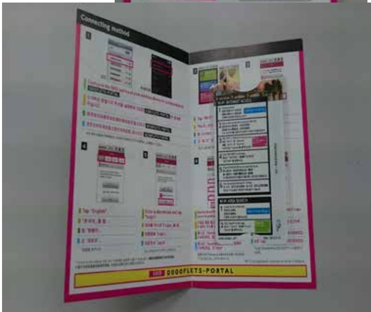
外国人観光客用 Wi-Fi 接続ガイドブックに差し込む「Japan Connected-free Wi-Fi」手順書