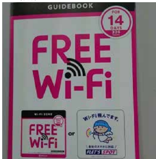
外国人観光客用 Wi-Fi 接続ガイドブック