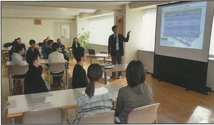
■ NTT東日本の事業概要について説明を聞く生徒たち