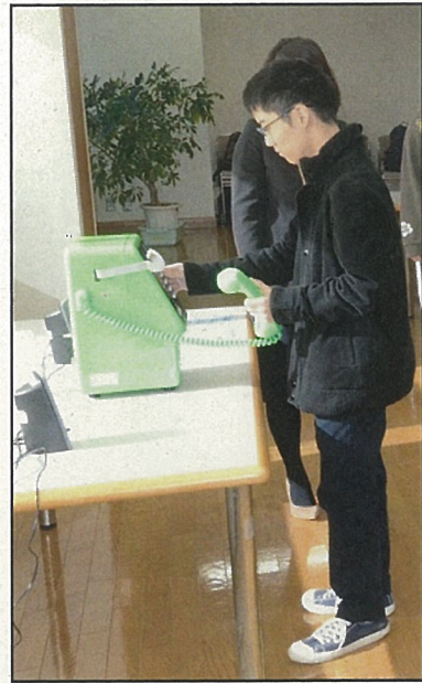
■ 公衆電話の利用体験