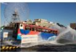
スカイダック横浜 スカイダック横浜招待券(ペア)