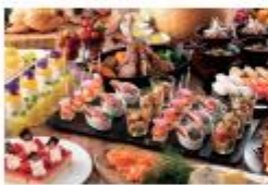
ヨコハマ グランド インターコンチネンタルホテル ブッフェ・ダイニング「オーシャンテラス」 ランチブッフェ(ペア)