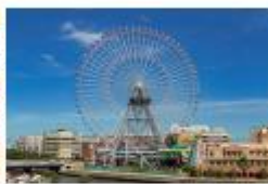
よこはまコスモワールド 大観覧車「コスモクロック21」 ご招待券(ペア)

このほかにも豪華景品が盛りだくさん! スタンプラリーの遊び方など、詳しくはこちら! https://expo2024.yokohamamarathon.jp/