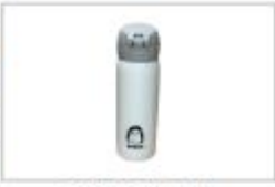
ENEOS株式会社 エネゴリくん ワンタッチポトル