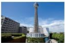
リストグループ 横浜マリンタワー 展望フロアチケット(ペア)