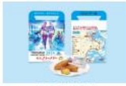
株式会社ありあけ 横浜マラソンハーバー