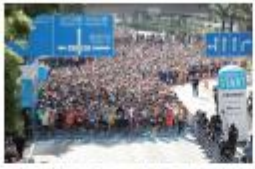
横浜マラソン組織委員会 横浜マラソン2025(仮称) フルマラソン出走権

スタンプの集め方は、マラソンコース周辺のマチナカスポットと、横浜マラソン協賛社によるONLINE EXPO スポット ※ 、スマートフォンのスタンプラリーページにあるSDGs ナゾトキスポットの3つ。集めたスタンプに応じてポイントが獲得でき、合計ポイント数にあわせて抽選権を得られます。抽選に応募するには、マチナカスポットは3ポイント以上、ONLINE EXPO スポットは1ポイント以上、SDGs ナゾトキスポットは2ポイント以上が必要です。 ※ONLINE EXPO スポットは10月17日から取得できます。