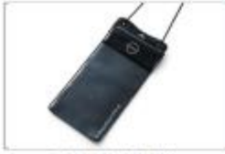
日産自動車株式会社 BASIC 防水マルチケース