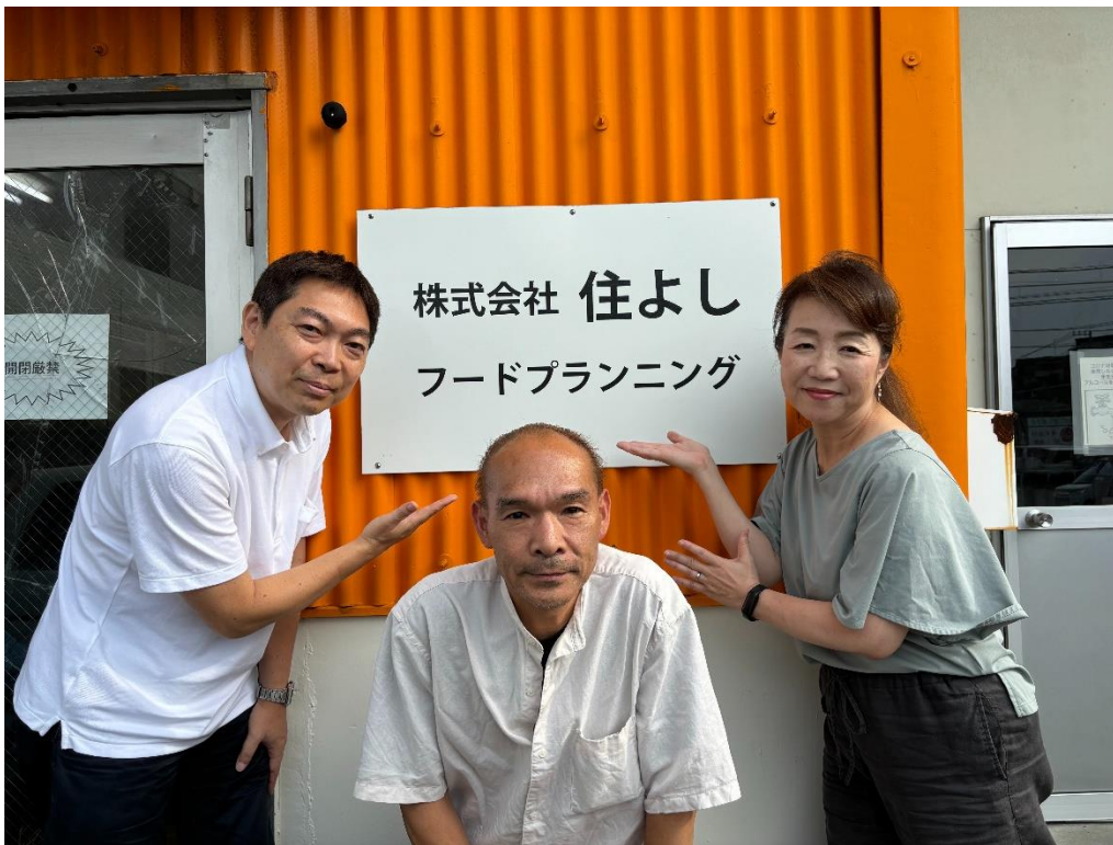
【写真】株式会社住よし 朝永専務取締役(中央)および NTT 東日本 神奈川事業部からの支援社員

〈*〉本件では、人材育成および社員のスキル・経験による活躍の場の提供と、人材支援を通じた地域企業成長促進を目的に2つ以上の仕事に同時に携わる働き方のこと。