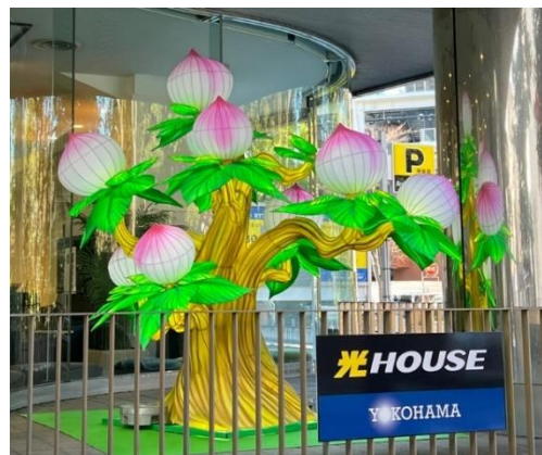
【NTT 東日本ショールームのランタンオブジェ設置模様】

2024年は、横浜中華街のほか、横浜ベイエリアを中心に32カ所に展開、スタンプを集めると景品として「春節福引き」紅包(ほんぱお)くじがもらえる春節デジタルスタンプラリーも実施します。