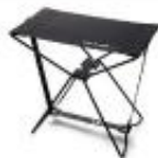
日産自動車株式会社 NISMO 折りたたみ コンパクトチェア