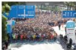
横浜マラソン組織委員会 「横浜マラソン2024」(仮称) フルマラソン出走権

スタンプが付与されるスポットは全部で59か所（マチナカスポット16か所、ONLINE EXPOスポット43か所）。集めたスタンプに応じてポイントが付与され、合計ポイント数にあわせて抽選権を獲得できます。抽選に応募するには、マチナカスポット、ONLINE EXPOスポットそれぞれ最低1つつ必要です。