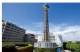
横浜マリントワー 横浜マリントワー 展望フロアチケット