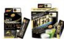
日清オイリオグループ株式会社 MCT CHARGE ゼリー PRO MCT CHARGE オイル