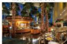
横浜ベイホテル東急 「カフェトスカ」 ディナーbuffet

このほかにも豪華景品が盛りだくさん！ スタンプラリーの遊び方など、詳しくはこちら！ https://expo2023.yokohamamarathon.jp/