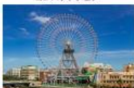
よこはまコスモワールド 大観覧車「コスモクロック21」 ご招待券