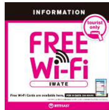
<参考：配布場所ステッカーイメージ>