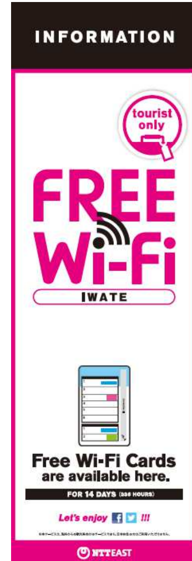
<参考：配布場所のぼりイメージ>