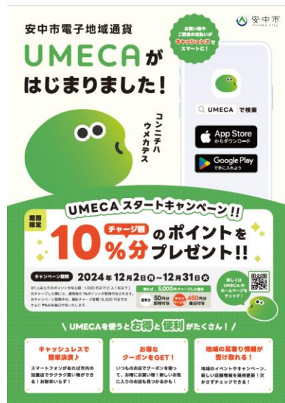
▲利用者向けチラシ