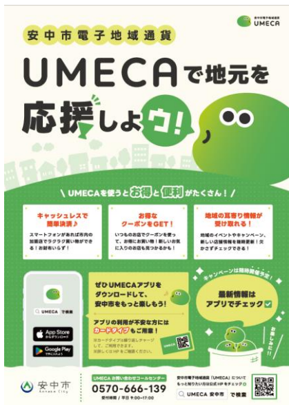
▲加盟店掲示ポスター