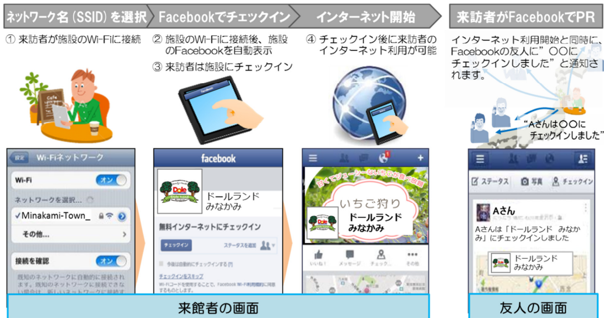
< 来訪者が「ギガらくWi-Fiによる公衆無線LAN」を利用開始する手順 >

ギガらくWi-Fiが備える「SNSによる口コミ助長の仕組み」とは、来訪者が施設の公衆無線LANを利用する際に、施設のSNS (Facebook) に”チェックイン”を促す仕組みです。