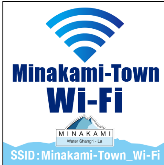
< Minakami Town Wi-Fi エリアサイン >