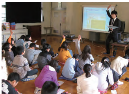
小学校での授業風景

インターネットを楽しく安全に使っていただくために、上手なコミュニケーションのとりかたやマナー、トラブルの回避方法などを分かりやすく説明します。