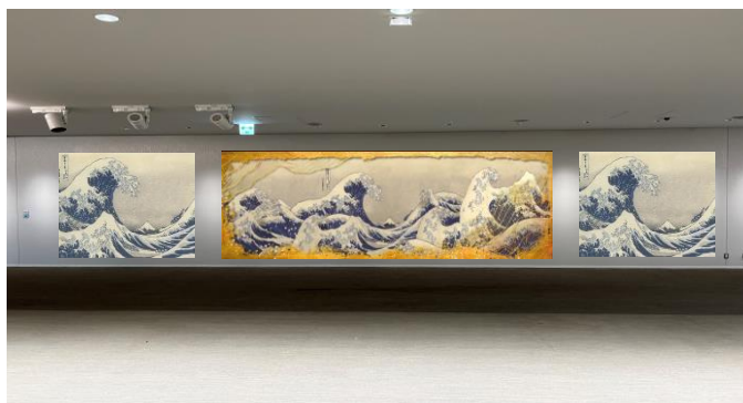
NAKED meets 北斎（動画）