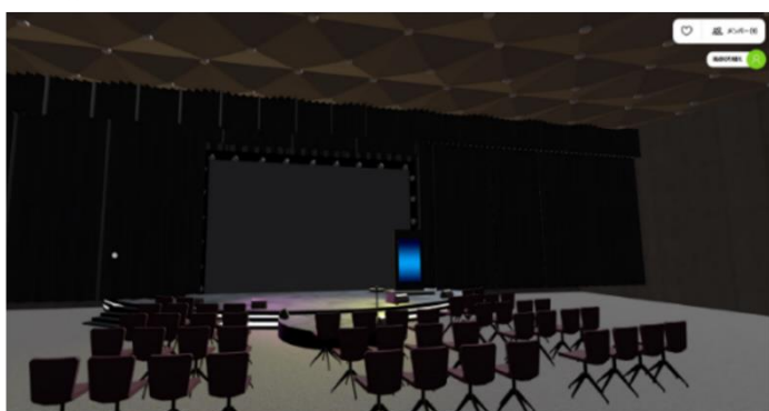
土蔵内 イベントステージ