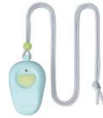
簡易型緊急通報装置「シルバーホンあんしんSV」 小電力型ワイヤレスリモートスイッチ5(送信機) ※11

※11 「シルバーホンあんしんSV(セット)」では本スイッチ 1 台がセット販売の対象となります。