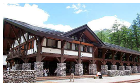
上高地インフォメーションセンター内