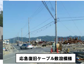
応急復旧ケーブル敷設模様