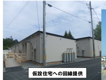
仮設住宅への回線提供