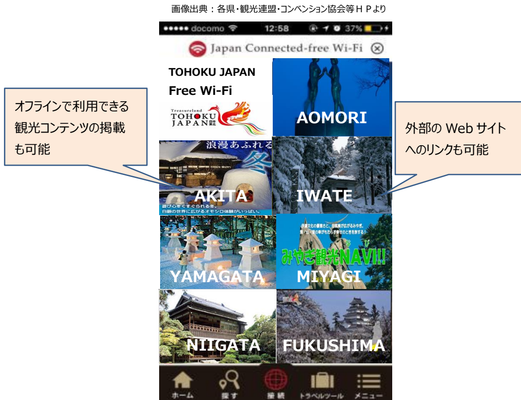
図1 「TOHOKU JAPAN Free Wi-Fi」の画面（イメージ）