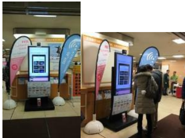
図 5 デジタルサイネージによる情報発信 (イメージ)