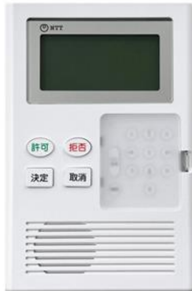
特殊詐欺対策アダプタ（イメージ）