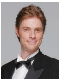
特別ナビゲーター セイン・カミュ 氏