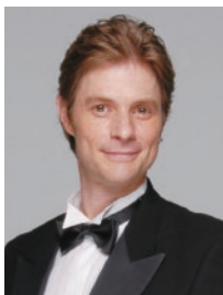
特別ナビゲーター セイン・カミュ 氏