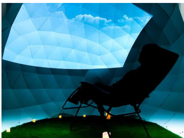
NTT ドコモ+乃村工芸社 NOMULAB《HUMANIC DOME》

《HUMANIC DOME》は、現在のコミュニケーションの主要な要素である言葉や表情からではなく、自身の内面の状態を知ることで他者とのコミュニケーションを行う次世代のつながりを実験する装置です。各種センサーで体験者の脈拍や姿勢などのデータを取得し、現在実験中のクラウド環境システムで数値化します。その数値情報を映像信号に変換し、リアルタイムでの可視化を試みます。体験者はドームの中に入り、自身と他者のデータから生成された映像と音響の重なりを視聴できます。《HUMANIC DOME》は、このような体験を通じて新しいコミュニケーションのあり方を問いかけます。