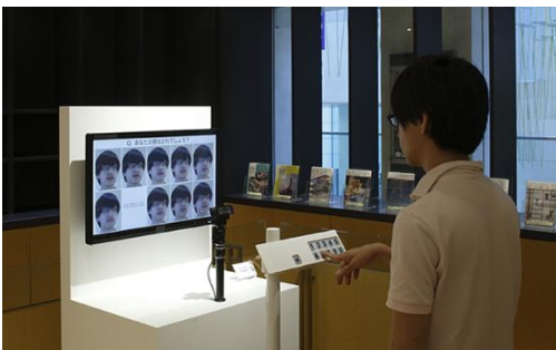
《自分の顔を探せ！》

今回新たに、音声版《自分の声を探せ！》および身体版《自分の身体を探せ！》を展示します。