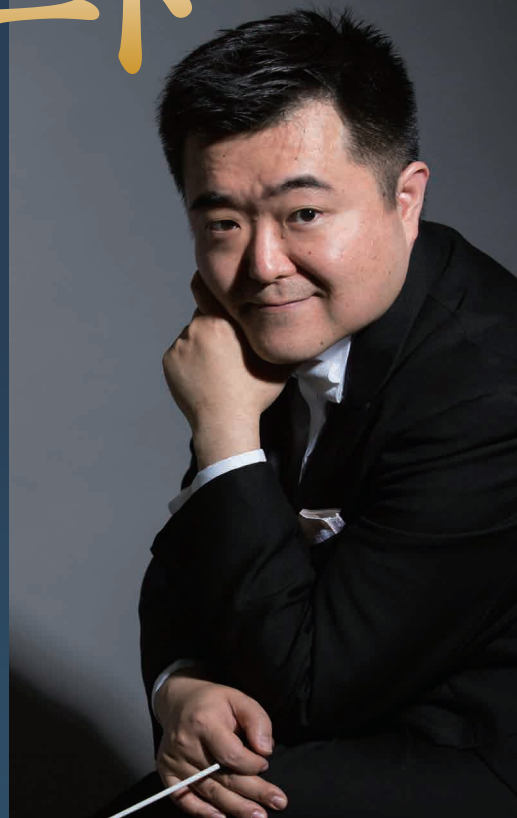
Ryuichiro Sonoda, conductor