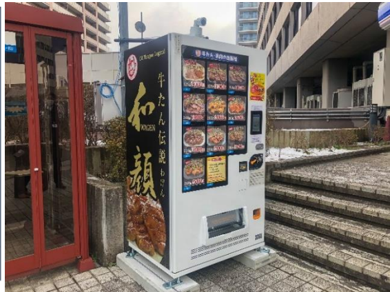
みやぎ・みちのくカイトク市場