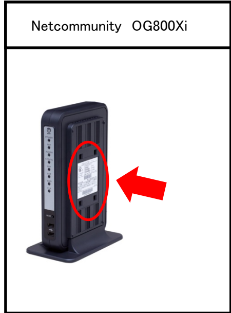
写真は縦置きの場合